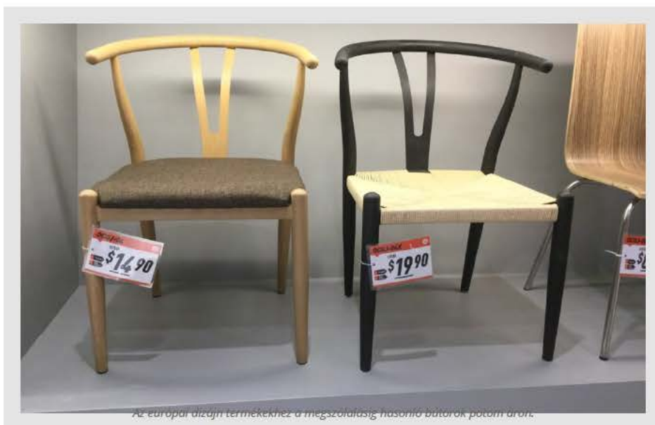
Az európai dizájn termékekhez a megszokottnál magasabb árúak a kínaiaké.

Akik megveszik, azok tehetősebbek és nem azt eszik, amit a többség az utcán. Viszont akkor nem magukra főznek, hanem van erre külön személyzetük. Állítólag itt ez a legmenőbb, a felesleges luxus. Sokan vannak, akik azért vesznek Ferrarit, hogy legyen egy a garázsban, talán havonta egyszer használják, de jó, ha van. Megőrülnek azért, ami a gazdagságot, Európát szimbolizálja.