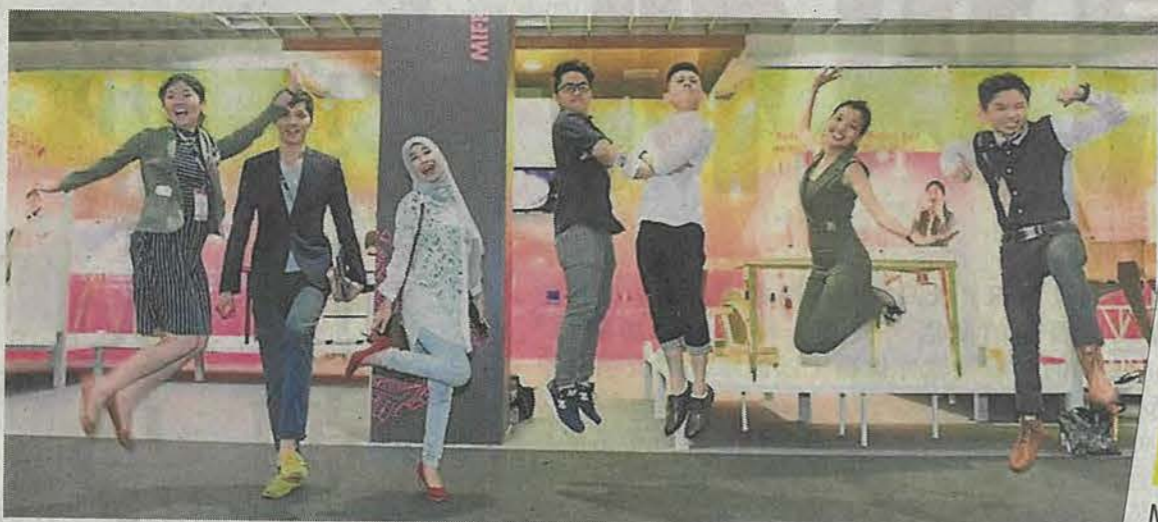
2016年度家具设计竞赛的优胜者,十强作品将在MIFF展出。