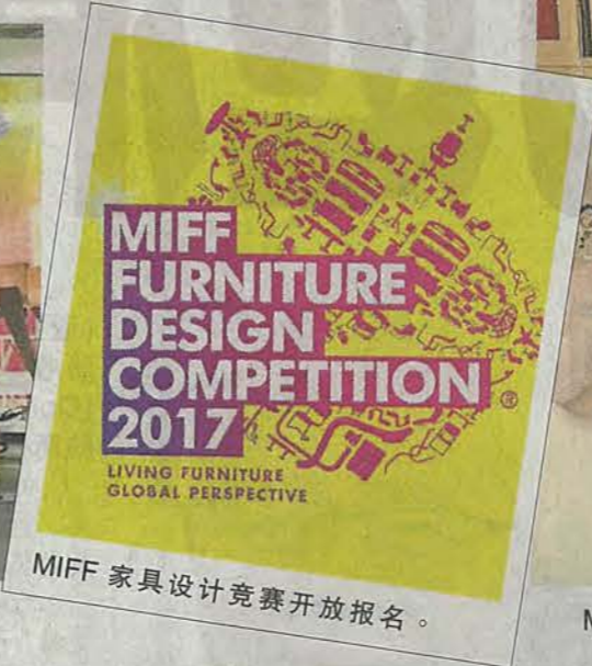
MIFF家具设计竞赛开放报名。