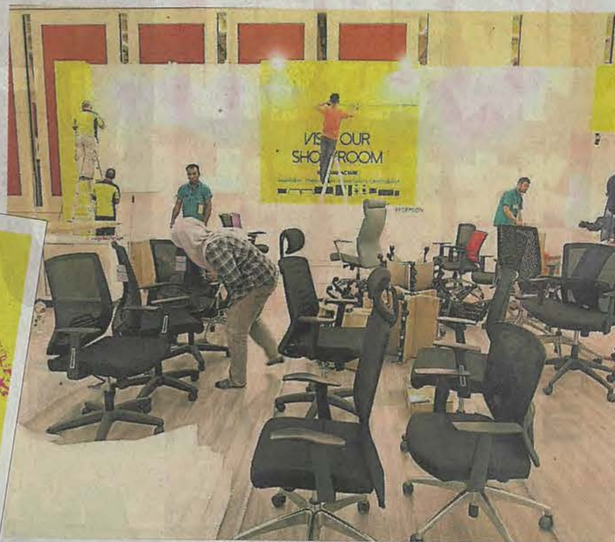
MIFF开展前一天,各参展商已如火如荼布置摊位。