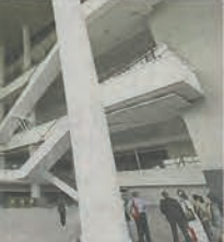
新的马来西亚国际贸易及会展中心(MITEC)将成为明年马来西亚国际家具展主要展出地点,不过太子世贸中心继续保留为展出地点。

“很多参展商及国际买家都认为,MIFF 需要继续在吉隆坡太子世界贸易中心举行,因为它方便,衔接酒店及购物中心,行走就可抵达展览中心。”