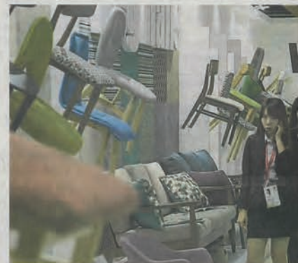
参展商琳琅满目的新产品及家具,单是座椅就设计百变。

进入十强的作品将获厂商赞助制作成原画,在 MIFF 展会的 FDC 特区展出。总决赛成绩将于展会第 3 天公布,同时举行颁奖典礼。